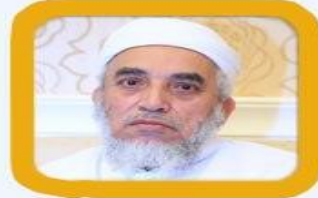
أحمد بن حسن سودان المعلم نائب رئيس هيئة علماء اليمن