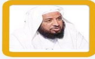
علي بن محمد باروس مفتي عدن